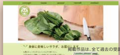
掲載作品は、全て過去の受講生作品